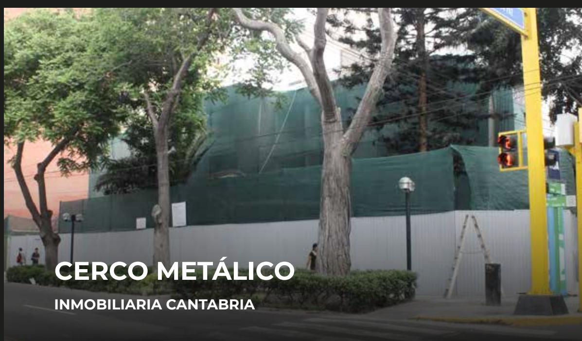
CERCO METÁLICO INMOBILIARIA CANTABRIA