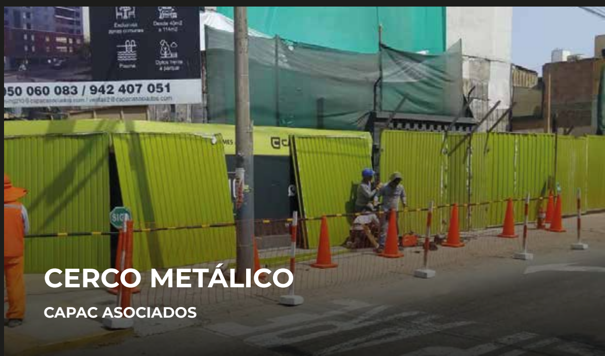
CERCO METÁLICO CAPAC ASOCIADOS

Somos especialistas en la fabricación de estructuras metálicas. Ofrecemos productos y servicios de gran calidad como: cercos metálicos, techos industriales, naves industriales, escaleras metálicas, etc.