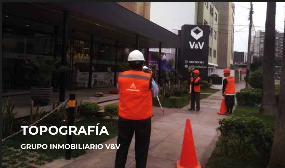
TOPOGRAFÍA GRUPO INMOBILIARIO V&V

Ofrecemos una gran experiencia de ejecución de proyectos grandes y complejos. Nuestro staff de profesionales cumple y sobrepasa las expectativas de cada cliente, aún en las condiciones más difíciles.