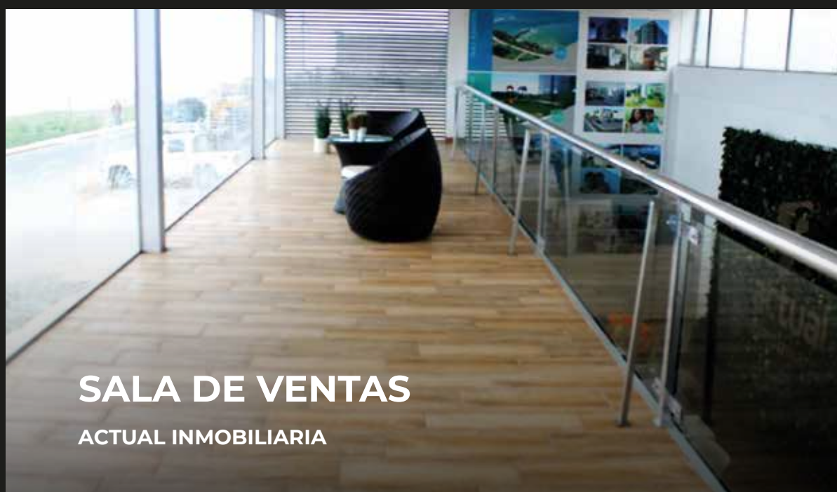
SALA DE VENTAS ACTUAL INMOBILIARIA